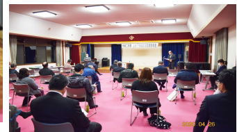
3密を防いだ会場設営